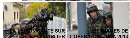
LA LÉGION SAÏTE SUR PONTARLIER