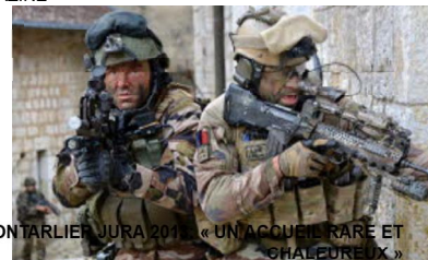
PONTARLIER JURA 2013 « UN ACCUEIL RARE ET CHALEUREUX »